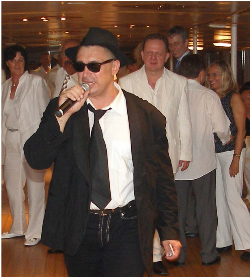
Der ist aber echt. Oder doch nicht. Ein Bluesbrother darf nie fehlen.